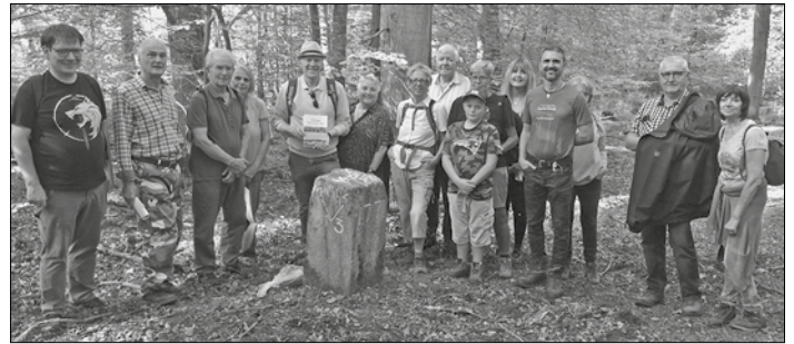
Text und Foto: Thomas Besse

vorbei wird im Herbst 2024 von der VHS Völklingen angeboten. Die Broschüre „Völklinger Grenzstein-Tour“ kann für 3 Euro bei der VHS Völklingen und in der Bäckerei Pusse in der Trierer Straße auf der Röchlinghöhe gekauft werden.