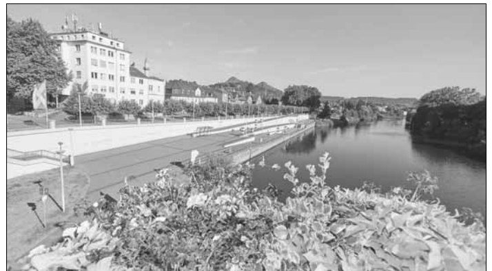
Text und Bilder von Thomas Wieck