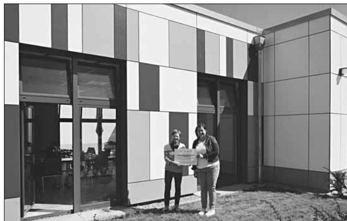
Foto: Übergabe von Zuwendungen an die Projektträger

Die Lokale Aktionsgruppe Warndt-Saargau e.V. wird als LEADER-LAG im Rahmen des Saarländischen Entwicklungsplans für den ländlichen Raum (SEPL) 2014 – 2020 ebenfalls aus Mitteln der Europäischen Union (75%) und des Saarlandes gefördert.