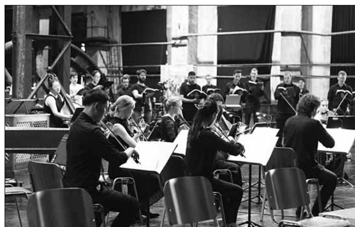
Konzert der HfM Saar im Weltkulturerbe Völklinger Hütte Aufführung der Johannes-Passion von Johann Sebastian Bach, 2021