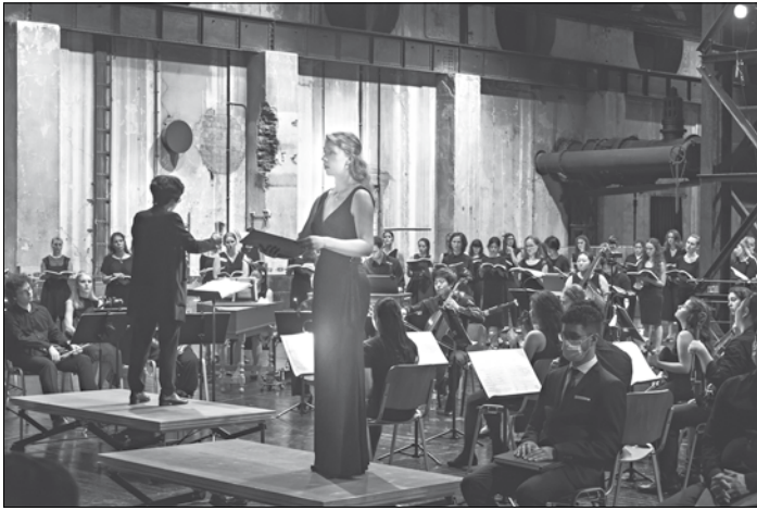
Konzert der HfM Saar im Weltkulturerbe Völklinger Hütte Aufführung der Johannes-Passion von Johann Sebastian Bach, 2021

nen sich die Kleinen austoben und beim Kinderschminken in verschiedenen Rollen schlüpfen. Zudem stellen sich verschiedene soziale Träger aus dem Quartier vor und bieten den Kindern unter anderem Bastelangebote, Bewegungsspiele und vieles mehr. Die BesucherInnen erwartet außerdem ein vielfältiges Essens- und Getränkeangebot. Das Stadtteilforum Nördliche Innenstadt, der Jugendmigrationsdienst im Quartier und das Stadtteilmanagement freuen sich auf die zahlreiche Gäste beim Stadtteilstfest.