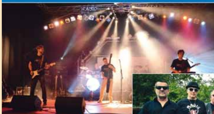
COMPLIMENT FOR SOUL

14. Juli - Fooling Around | 21. Juli - The Gambles | 28. Juli - Frantic 4. August - Elliot | 11. August - Compliment for Soul | 18. August - MAGIC