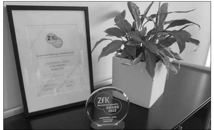
Ganzheitlich und nachhaltig – mit dem Konzept „Volle Ladung: Nachhaltige Mobilität für alle“ holen die Stadtwerke Völklingen Gold beim ZfK-Award 2022 und bringen die E-Mobilität ins Saarland.