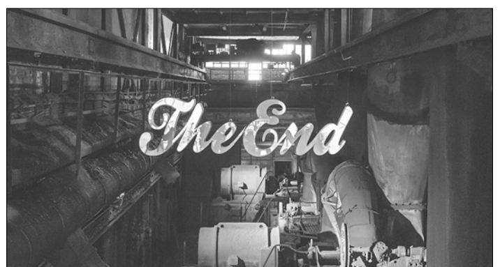
Ort des Kunstwerks: Ventilatorenhalle Weltkulturerbe Völklinger Hütte