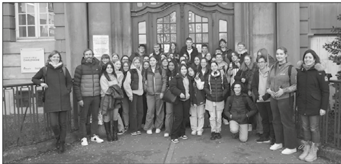
Austauschgruppe aus Geislautern und Thionville mit ihren Lehrerinnen und Lehrern

Ein besonderer Dank für Organisation und Durchführung des Austauschprogramms gilt Französischlehrerin Frau Chiron.