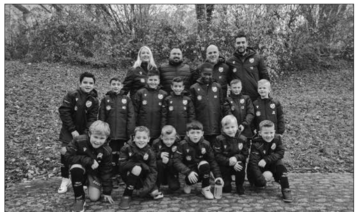
Die F-Jugend samt Betreuerstab geht zurzeit in der Halle auf Titeljagd.