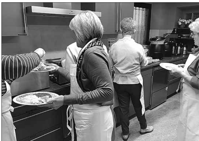
Bereits im vergangenen Jahr beteiligte sich die Emmausstube an den Wintercafés.