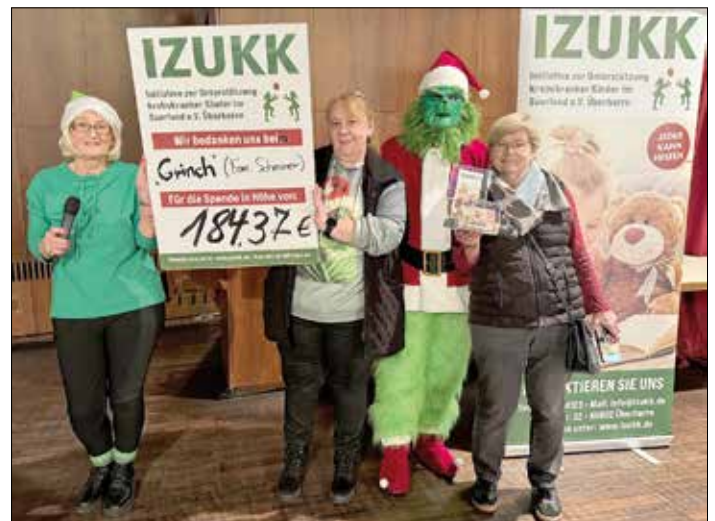
Fotos mit dem Weihnachtsgrinch im Überherrner Kulturhaus