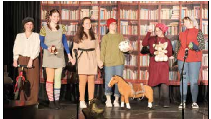
Leseabend für Viertklässler am WG begeistert das Publikum

Ein besonderer Dank gilt allen, die durch ihr großes Engagement diesen Abend möglich gemacht haben.