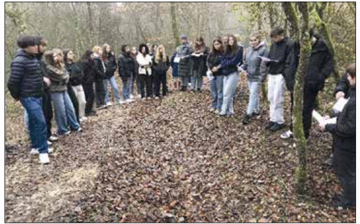
Vortrag des Anti-Kriegs-Gedichtes von Wolfgang Borchert (1947) „Sag Nein!“ am Boyau de Londres (Schützengraben)