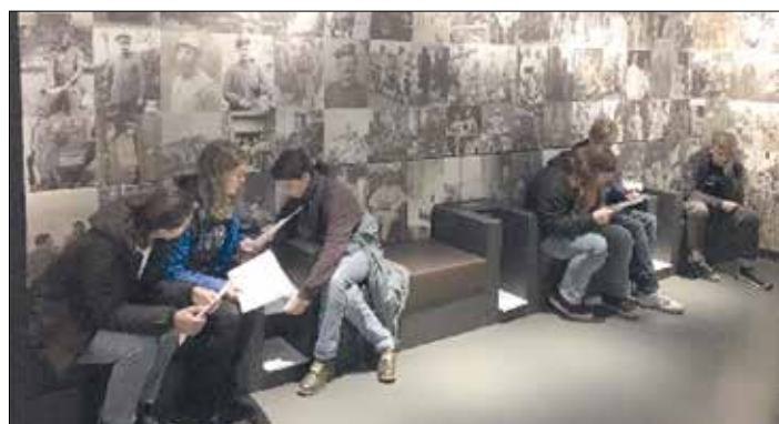
SchülerInnen lesen Feldpostbriefe französischer und deutscher Soldaten

Alle LehrerInnen und SchülerInnen bedanken sich bei der Stiftung ‚Frieden lernen – Frieden schaffen‘, die diese Exkursion finanziell unterstützt hat. Ohne diese finanzielle Hilfe wäre heute vor allem wegen der hohen Buskosten kaum noch ein solcher Tagesausflug möglich.