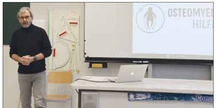
Vortrag über Ruanda und die Krankheit Osteomyelitis