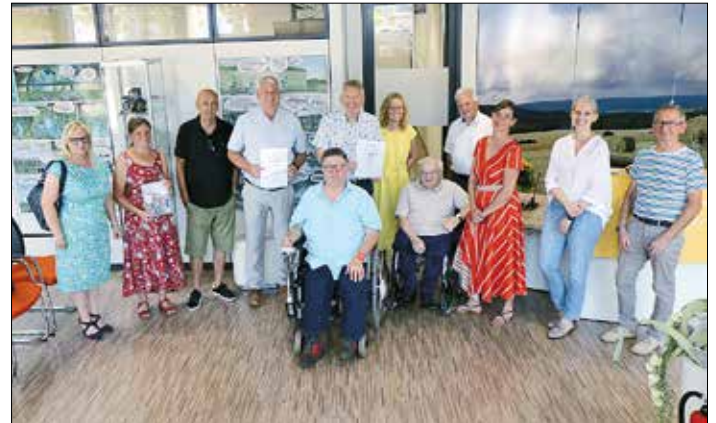
Gruppenfoto in der Touristen-Information Saarlouis anlässlich der beiden Zertifizierungen mit Landrat Patrik Lauer (hintere Reihe, 5. von links) und Oberbürgermeister Peter Demmer (4. von links).

Verfügbarkeit. Hier befinden sich auch jeweils behindertengerechte WCs sowie Parkplätze beim Start- und Endpunkt. Die Führungen sind auch in leichter Sprache buchbar, zudem steht eine mobile FM-Anlage für den Hörkomfort zur Verfügung.