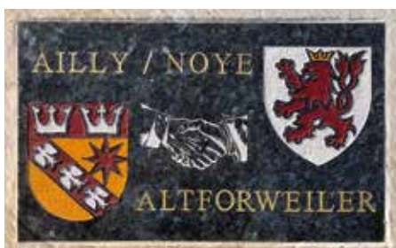
Plakette auf dem Gedenkstein