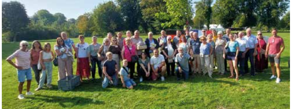
Gruppenfoto am neuen Gedenkstein mit der Gruppe Altforweiler - Ailly:

16 Erwachsene und 8 Jugendliche verbrachten wieder drei erlebnisreiche Tage in der Partnergemeinde Ailly-sur-Noye in der Picardie. Nach der 420 km langen Anreise trafen sich alle Teilnehmer am Freitagabend gegen 19.30 Uhr an der Mairie in Ailly, um anschließend in den Familien den Abend gemeinsam zu verbringen.