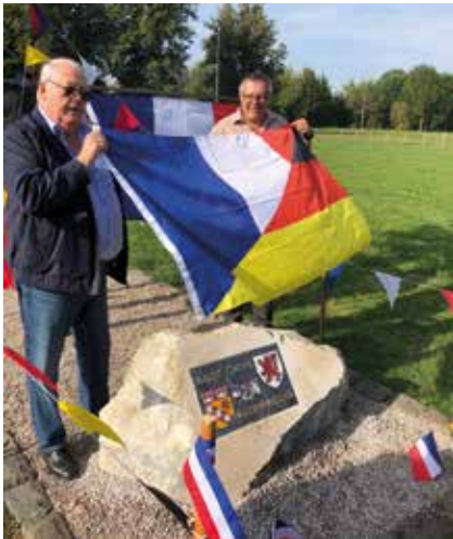
Enthüllung des Gedenksteins