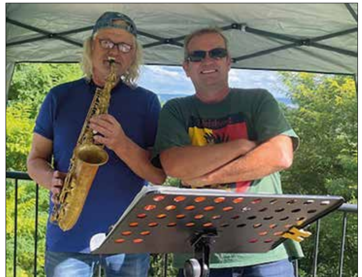
Der Saxophonist und der 1. Vorsitzende

Wie bedanken uns bei den vielen Helfern, bei dem tollen Saxophon-Spieler, bei den Kuchenspendern, bei den Unterstützern beim Verkauf und natürlich besonders bei den zahlreichen Besuchern für ihr Kommen.