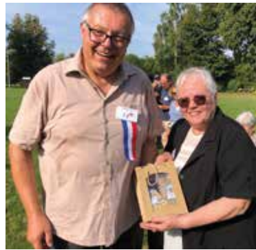
Austausch von Erinnerungs- geschenken