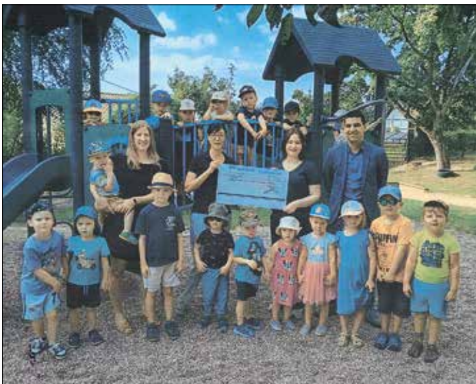
Das Team der Kita St.Oranna