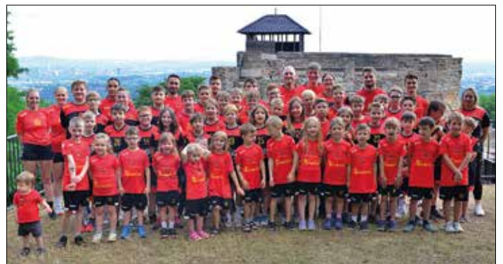
Jungfalken mit ihren Trainerinnen und Trainern

Mehr als 80 Kids sind zur Zeit mit viel Spaß und Geschick in Überherrn und Saarlouis bei den Minis, F, E, D und C Jugend im Jugendtraining. Durch unsere Aktivitäten in den Kitas und Grundschulen konnten wir viele für diesen tollen Mannschaftssport begeistern. Obwohl die Saison nun zu Ende ist, wird bis zu den Sommerferien weiter trainiert, nun auch schon in den