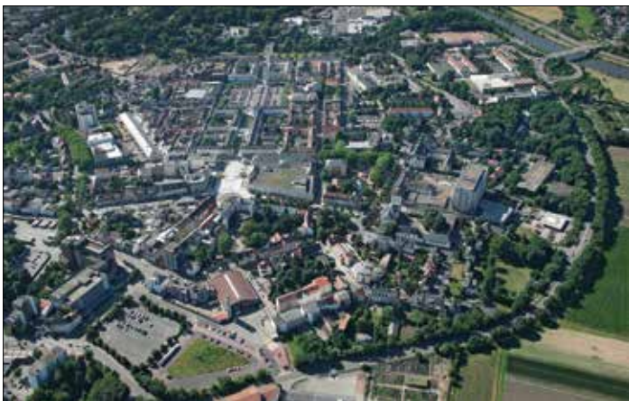
Saarlouis Festungsstadt Luftbild 2008

Die 1680 durch den französischen König Ludwig XIV. gegründete Festungsstadt Saarlouis wurde von dem Festungsbaumeister Sébastien de Vauban und dem Ingenieur Thomas de Choisy entworfen. Sie wurde auf besetztem Gebiet des Herzogtums Lothringen errichtet. Es entstand ein regelmäßiges Stadtgebilde mit quadratischem Paradeplatz als Zentrum und orthogonalem Straßenraster als Grundlage für die Bildung gleichmäßiger Quartiere. Bis heute ist diese Struktur trotz späterer Um- und Neubauten im Wesentlichen erhalten geblieben. Viele bedeutende Gebäude aus der Festungszeit prägen den städtebaulichen Kontext von Saarlouis. Ferner sind beispielhafte Teile der früheren Fortifikationsanlagen erhalten und in den vergangenen Jahren umfänglich restauriert worden. Auch der Verlauf der ehemaligen Wälle und Gräben, die als sechsfacher Stern die Stadt umgaben, ist in den Ringstraßen des 19. Jahrhunderts erkennbar.