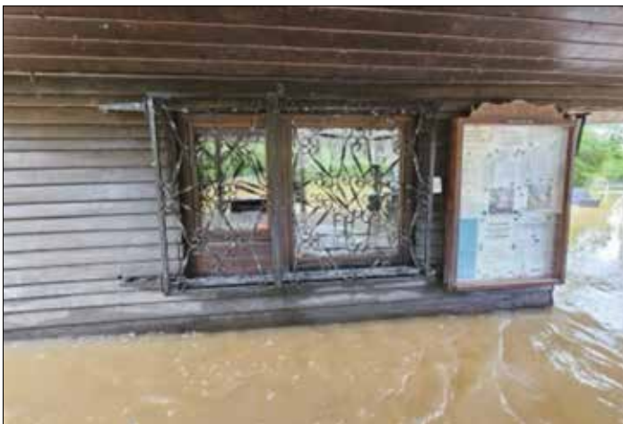
Fotos vom 18.05 ca. 11.00 Uhr – Höhe des Scheitelpunktes siehe Fenster