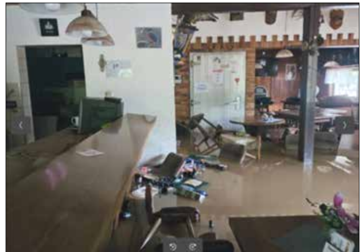
Zerstörte Inneneinrichtung - Foto vom 18.05.24 – ca. 21.00 Uhr

Wir schätzen den entstandenen Schaden auf ca. 42.000 Euro. Da sich unser Vereinsheim direkt an der Bist befindet, war es uns bisher nicht möglich, eine Versicherung zu finden, die unser Vereinsheim entsprechend elementar absichert. Wir müssen daher den entstandenen Schaden aus Spenden und eigenen Mitteln begleichen, was uns vor eine nie dagewesene Herausforderung stellt. Das Vereinsvermögen reicht dabei bei weitem nicht aus. Um diesen kleinen Fleck Natur wieder herzurichten, sind wir auf Spenden angewiesen. Wer etwas Spenden möchte kann sich einfach unter 015252671808 melden. Auch besteht die Möglichkeit, die Spende bei unserem Fischerwirt abzugeben.