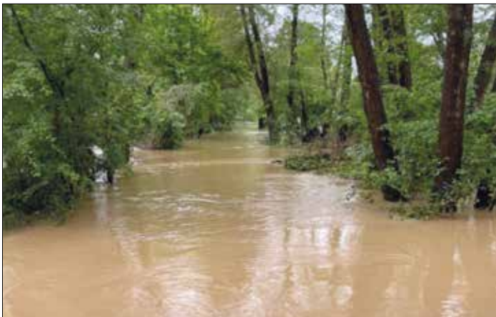
Hinten rechts unsere Fischerhütte – Foto vom 17.05.24 ca. 15.00 Uhr – Scheitel-punkt Hochwasser noch nicht erreicht.