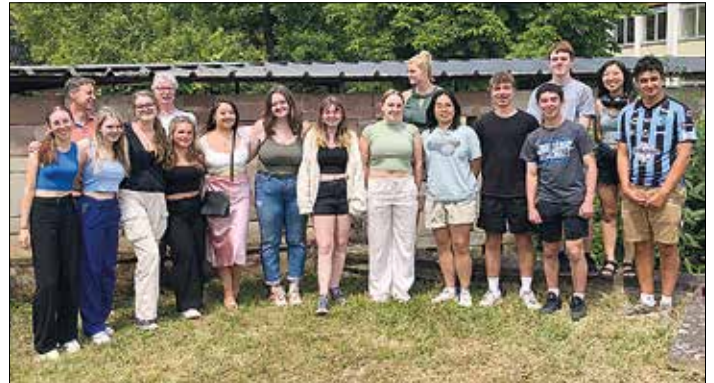
Die Amerikanischen Gäste mit den Schülern und Betreuern des Saarlouiser Gymnasiums am Stadtgarten

war tatsächlich im Vorfeld schon zur Saarlouiser Woche und zum Feuerwerk an der Emmes eingeladen gewesen. Auch am zweiten Tag durften die Gäste am Unterricht teilnehmen und mit den deutschen Gastgebern noch einen weiteren Nachmittag verbringen. Zum Abschluss traf man sich zum gemeinsamen Abendessen in den Kasematten von Saarlouis.