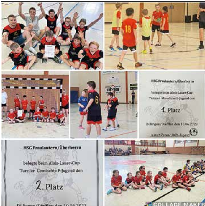
Bildunterschrift: unsere Jugendteams beim Alois Lauer Cup

Am Samstag nahmen die Falken mit den neu formierten F und E Jugendmannschaften am Dieffler Alois Lauer Cup teil. Unsere HSG gF Jugend, die aus vielen Neulingen besteht, zeigte eine gute Leistung, kämpfte in der Abwehr und spielte auch im Angriff schon mit tollen Kombinationen. Zu aller Überraschung konnten sie am Ende den 2. Platz belegen. Unsere HSG mE Jugend ließ ihren Gegnern mit schönen Kombinationen, guter Abwehr – und Torhüterleistung keine Chance und wurde souveräner Turniersieger. Glückwunsch an die Teams und weiter so.