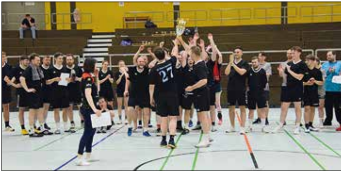
Turniersieger HC Super Samstag