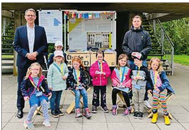
Die Vorschulfüchse der Kita St. Oranna Berus