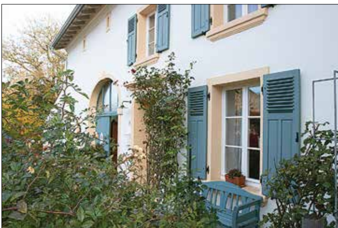
Dieses Bauernhaus in Wallerfangen-Leidingen wurde bei der vergangenen Ausgabe des Wettbewerbes mit einem Anerkennungspreis ausgezeichnet.

Der im zweijährigen Turnus stattfindende Wettbewerb „Saarländische Bauernhäuser – Zeugnisse unserer Heimat“ geht 2023 in die 20. Runde. Hierfür werden saarländische Bauernhäuser und Arbeiterbauernhäuser gesucht, die vor dem Jahre 1914 erbaut wurden. Jüngere, bis 1945 erbaute Bauern- und Arbeiterbauernhäuser sind ebenfalls zum Wettbewerb zugelassen, wenn sie einen für die Entstehungszeit charakteristischen Gebäudetyp repräsentieren. Ob die Häuser heute noch der Landwirtschaft dienen oder nicht, spielt keine Rolle. Es sind Preise und Anerkennungen in einer Gesamthöhe von 10.000 Euro ausgesetzt. Sie bestehen aus einem Geldbetrag und einer Urkunde sowie – für die preisgekrönten Häuser – einer Plakette, die an dem prämierten Gebäude angebracht werden soll.