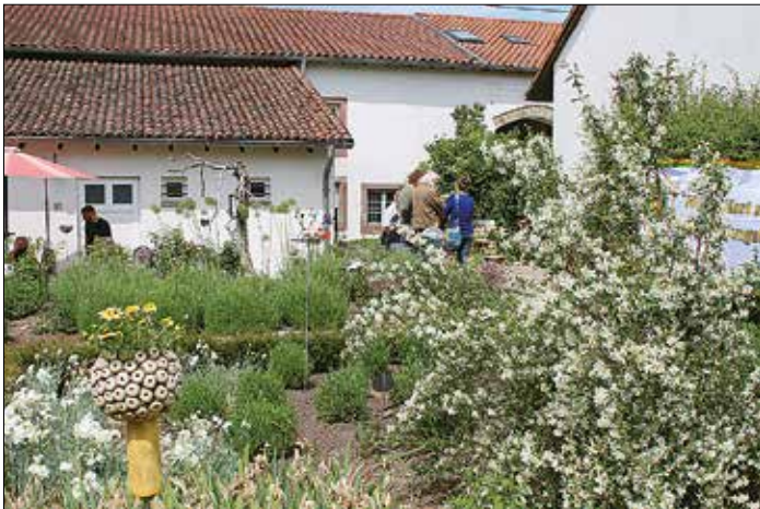
Duft- und Würzgarten Haus Saargau.jpg – Der Duft- und Würzgarten hinter Haus Saargau in Gisingen.