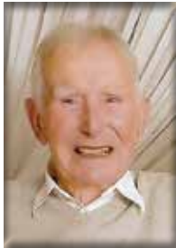
Felsberg, im April 2024