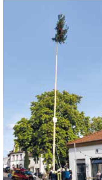
Förderverein der FFW Berus