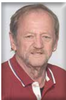
Überherrn-Bisten und Beaumarais

Unser Herz will Dich halten. Unsere Liebe Dich umfassen. Unser Verstand muss Dich gehen lassen. Denn Deine Kraft war zu Ende und Deine Erlösung eine Gnade.