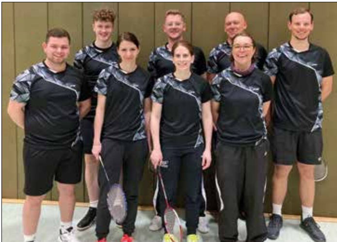
Finalteilnehmer Saarlandpokal, 1. Mannschaft BSG Schaffhausen/Überherrn