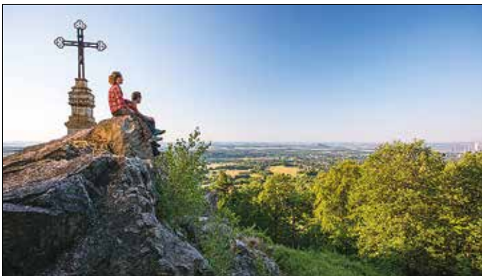
Ein Blick vom Gipfel des Litemonts über den Landkreis Saarlouis.

In einem kürzlich erschienenen Beitrag hat das Online-Magazin „reisereporter.de“ 15 Geheimtipp-Ziele für einen Urlaub in Deutschland veröffentlicht. Unter der Rubrik „versteckte Perlen“ wurden diejenigen Orte gewürdigt, die besondere Sehenswürdigkeiten zu bieten haben ohne dabei von Menschenmassen überfüllt zu sein. Mit dabei: Der Landkreis Saarlouis.