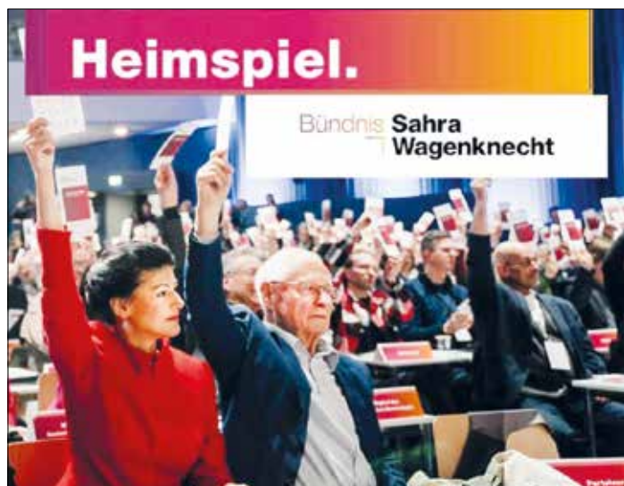
Ein weiterer wichtiger Schritt im Aufbau der jungen Partei, wurde am Freitag dem 22.03.24 in der Stadthalle in Merzig vollzogen.

Der saarländische Landesverband Bündnis Sahra Wagenknecht wurde gegründet.