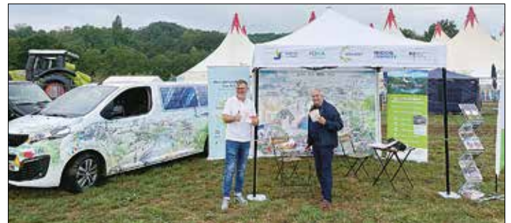
Genuss-Markt Lebach 2022,

Hintergrund: Konnekt steht für interkommunale Kooperation und Transformation als Grundlage einer regionalen Kreislaufwirtschaft und einer nachhaltigen Regionalentwicklung im Landkreis Saarlouis. Neben dem Landkreis sind die Stadt Saarlouis und die Gemeinde Nalbach Projektpartner, sie beschäftigen sich mit Themen wie Kreislaufwirtschaft und nachhaltigen Gewebegebieten. Ziel ist es, den Landkreis Saarlouis unter aktuellen Aspekten wie Strukturwandel, demographischer Wandel und Klimawandel für die Zukunft nachhaltig, lebenswert und leistungsstark aufzustellen. Als Transferkommunen sind die Städte Eisenhüttenstadt und Spremberg, Erfurt und Weimar sowie der Landkreis Weimarer Land als Transferregionen in das Projekt Konnekt eingebunden.