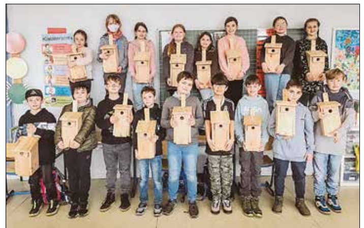
Bericht und Foto: V. Augustin, Schulleiter