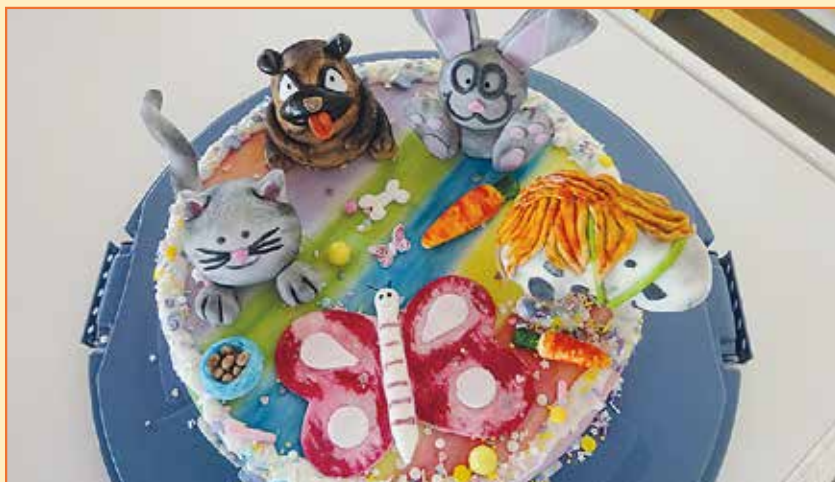
Hier noch ein Highlight von der Kuchentheke, ein Kuchen für die Kita mit allen Symbolen der jeweiligen Gruppen.