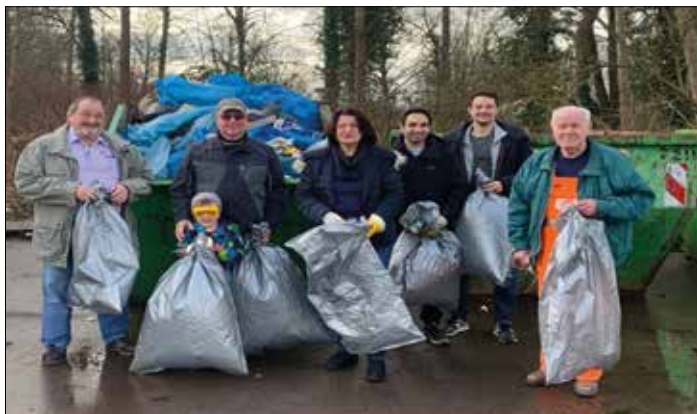
Das Bild zeigt alle Beteiligten, außer dem Schriftführer, der für das Foto zuständig war.