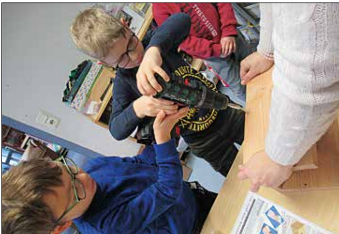
Mit geschickten Händen und in Teamarbeit waren die Kästen im Nu zusammengebaut!