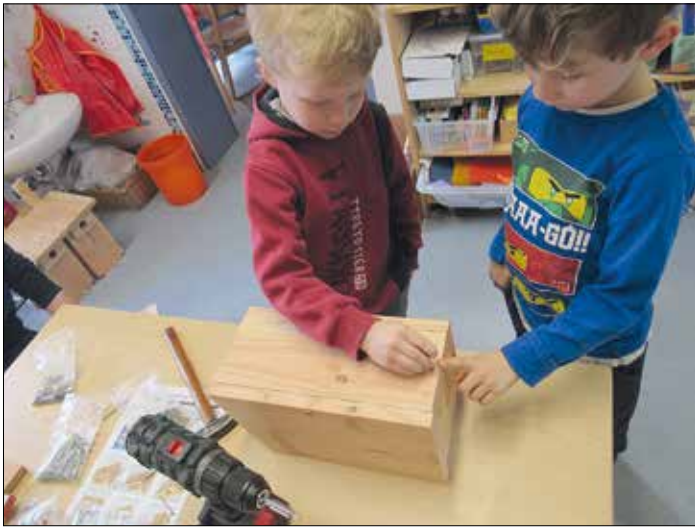
Unsere Jungs waren tatkräftig bei der Arbeit!