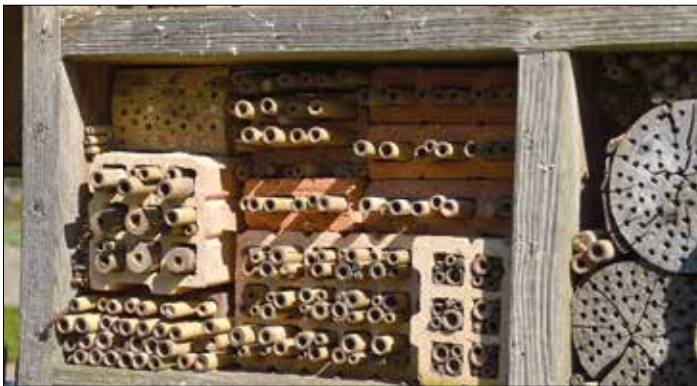
© Monika Lambert-Debong – Bienenhotel im heimischen Garten.

Das kombinierte Praxisseminar gibt Tipps und Informationen rund um Artenschutz und zeigt, wie im Garten und auf der Obstwiese Vögel, Insekten und andere Tiere unterstützt werden können.