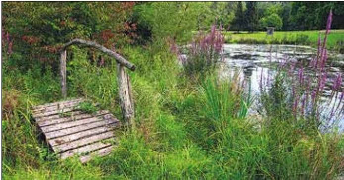
Idylle am Teich: Pflanzenvielfalt bietet Lebensraum

Der Landkreis Saarlouis zeichnet im Rahmen des 35. Umweltpreises innovative Projekte zum Themen-Schwerpunkt „Förderung der Biodiversität durch Maßnahmen der Renaturierung sowie Maßnahmen zum Schutz der heimischen Flora und Fauna“ mit Preisgeldern in Höhe von 5.000 Euro aus. Ab sofort können sich Interessierte bewerben.