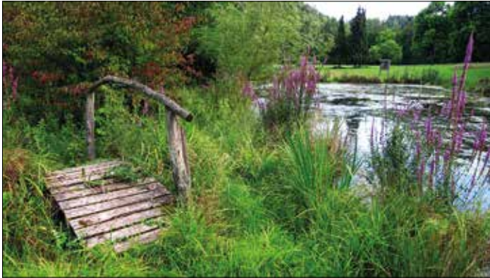
Idylle am Teich: Pflanzenvielfalt bietet Lebensraum

Der Landkreis Saarlouis zeichnet im Rahmen des 35. Umweltpreises innovative Projekte zum Themen-Schwerpunkt „Förderung der Biodiversität durch Maßnahmen der Renaturierung sowie Maßnahmen zum Schutz der heimischen Flora und Fauna“ mit Preisgeldern in Höhe von 5.000 Euro aus. Ab sofort können sich Interessierte bewerben.