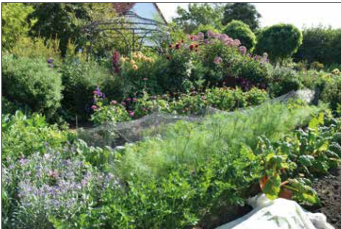
© Monika Lambert-Debong - Garten am Haus: Eine abwechslungsreiche Mischung von Nutz- und Zierpflanzen

Der Landkreis Saarlouis zeichnet im Rahmen des 35. Umweltpreises innovative Projekte zum Themen-Schwerpunkt „Förderung der Biodiversität durch Maßnahmen der Renaturierung sowie Maßnahmen zum Schutz der heimischen Flora und Fauna“ mit Preisgeldern in Höhe von 5.000 Euro aus. Ab sofort können sich Interessierte bewerben.