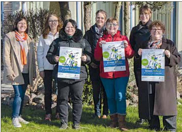
Der Arbeitskreis Frau und Gesundheit des Landkreises lädt zum Vortrag für (berufstätige) Mamas ein.