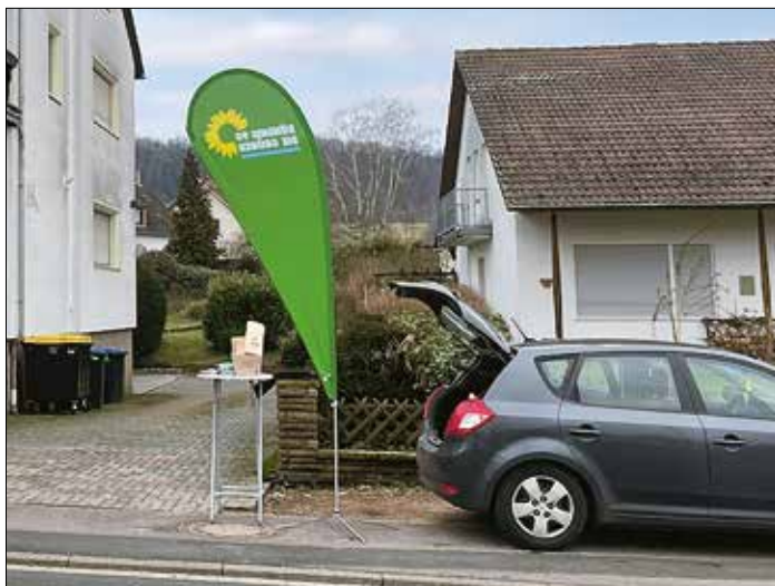
Grüner Wahlinformationsstand am letzten Samstag von 8-10 Uhr in Felsberg vor der Bäckerei.

Nach dem kurzweiligen Vortrag laden wir zu einer Diskussion zu dem Thema ein. Ebenso steht Ihnen / Euch der Referent für Ihre / Eure persönlichen Fragen zur Verfügung.