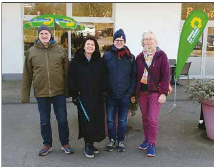
Grüner Wahlinformationsstand am letzten Samstag von 14-16 Uhr am Edeka in Altforweiler