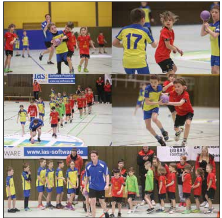
Unsere Jüngsten mit Begeisterung und vollem Einsatz beim letzten Heimspiel!

Keine Chance hatte unser junges Team. Alle waren mit viel Eifer bei der Sache, kämpften und rackerten um jeden Ball und jede Chance. Leider wollte heute kein Treffer gelinge. Toll gekämpft und trotz der deutlichen Niederlage viel Spaß gehabt.