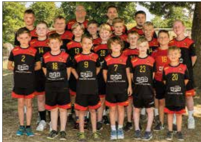
Unsere männliche D Jugend

Dienstag 16 – 17 Uhr Adolf Collet Halle Donnerstag 17:30 – 19 Uhr Fliesenhalle Saarlouis