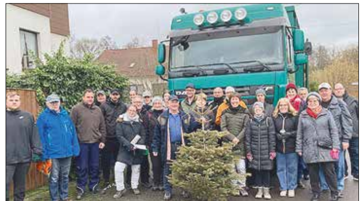
Das Bild zeigt die fleißigen Helfer der Tannenbaumaktion in diesem Jahr. Infos über den Verein auch unter www.izukk.de