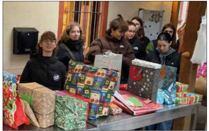
Weihnachtsengel-Aktion des WG beschenkt 140 Kinder