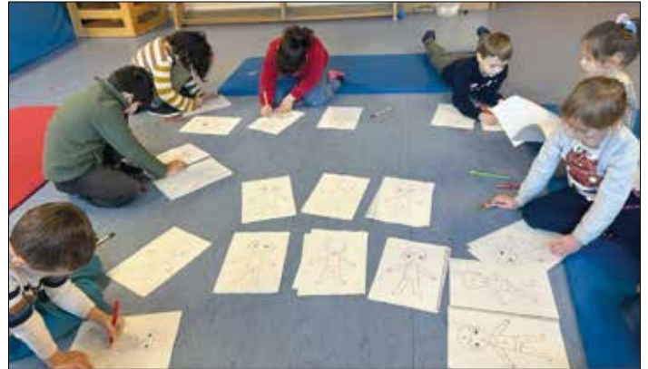
Die Vorschulfüchse der Kita St. Oranna Berus

Dazu treffen wir uns in jeweils 2 Kleingruppen in der Turnhalle. Wir erarbeiten diverse Themen die uns „stark machen“ sollen. Es geht unter anderem darum, dass man nicht alles zulassen muss und dass es in Ordnung ist „Nein“ zu sagen und sich Hilfe zu holen wenn man sie benötigt.