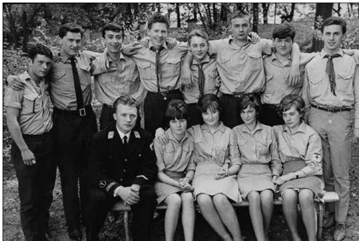
Ormesheimer Gruppen A + B Kreissieger beim JRK - Kreiswettbewerb 1966 in St. Ingbert

Zu den jährlich stattfindenden Kreiswettbewerben musste viel gelernt und geübt werden. Die Wettbewerbsaufgaben umfassten die Gebiete Erste Hilfe in Praxis und Theorie, Rot-Kreuz-Geschichte, Staatsbürgerkunde, Allgemeinwissen, Fahrt und Lager und Singen. Wir wurden mehrmals Kreissieger, einmal sogar mit zwei Gruppen punktgleich Erster. In diesem Jahr belegten wir beim Landeswettbewerb den 2. Platz.