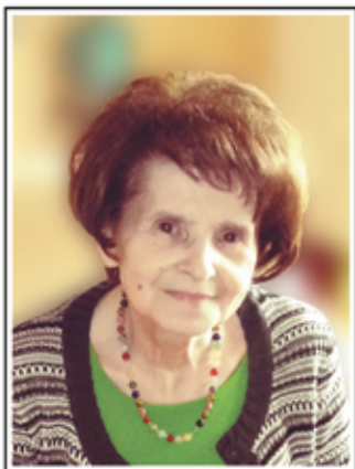
66386 St. Ingbert

Oft hast du andere froh gemacht und stets an dich zuletzt gedacht, nun ruhest du aus von deinem Schmerz.