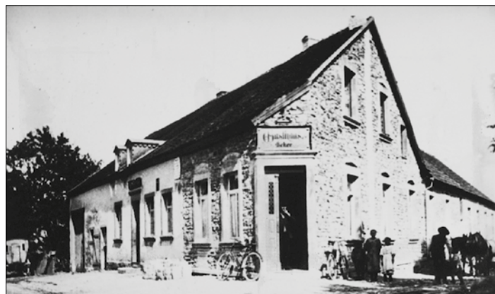
Gasthaus Ecker („Eckersch“) in früheren Zeiten, heute Gasthaus Niederländer

Keiner von ihren Familien – Nachkommen wird ihren Dorf-Berühmtheitsstatus jemals erreichen.