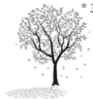
Bliesmengen-Bolchen, im Februar 2024