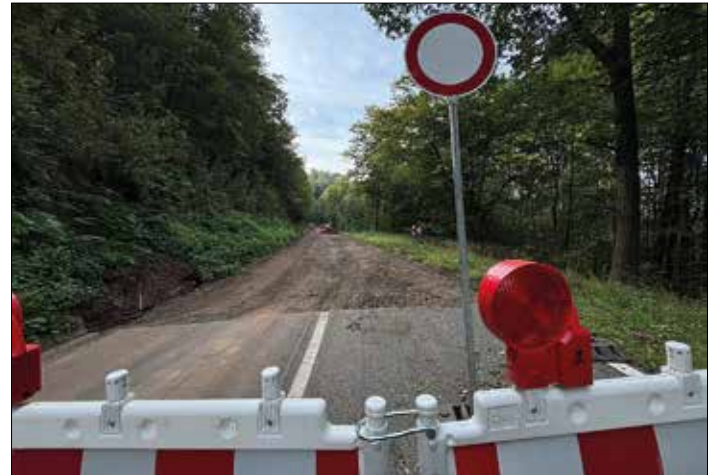
Foto: Straßenbauarbeiten am Staffel; Stefan Eins, Gemeinde Mandelbachtal

Die Sanierungsarbeiten an der Landesstraße L 108 „Staffel“ zwischen St. Ingbert und Heckendalheim verlaufen schneller als ursprünglich geplant, sodass die Strecke voraussichtlich bereits Ende Oktober 2024 wieder freigegeben werden kann. Die Straße war während eines schweren Unwetters am 17. Mai 2024 massiv beschädigt worden, als Starkregen eine großflächige Unterspülung verursachte. Der betroffene Streckenabschnitt verbindet St. Ingbert mit dem Flughafen und der Gemeinde Mandelbachtal und ist eine wichtige Verkehrsader für die Region.