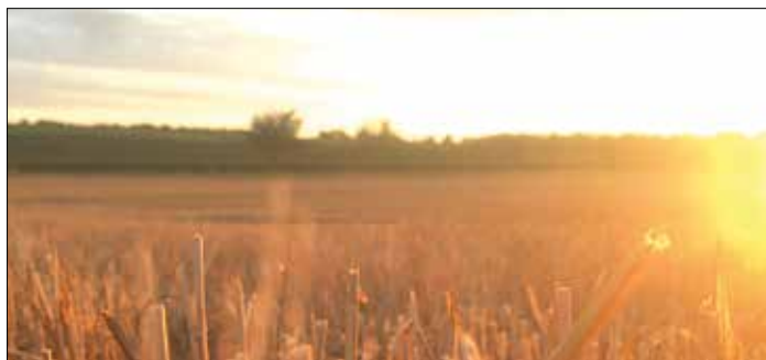
1930_Weizen-Strohhalme