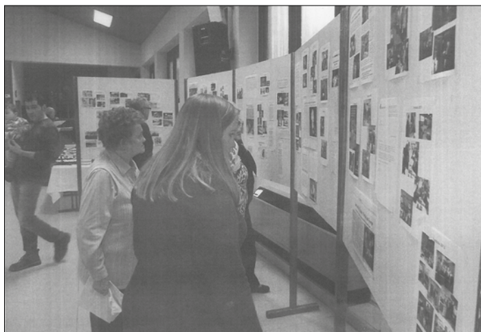
Das Foto zeigt die Tombola-Abschluss-Veranstaltung im Jahr 2014.

Band 12 der Bebelsheimer Geschichte informiert über Bruder Pirmin