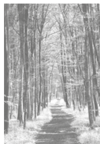
Bliesmengen-Bolchen, im Mai 2024