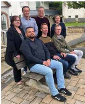
Ihr SPD Ortsratsteam