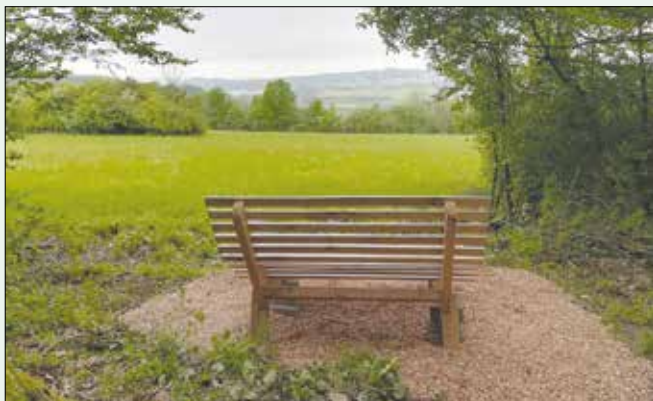
Die neue Sinnenbank im Kirchenwald

Die noch im Dezember bestellte Sinnenbank wurde vom Bauhof am 2. Mai an einem Aussichtspunkt am Rand des Kirchenwalds mit Blick auf Ensheim vom Bauhof aufgestellt.