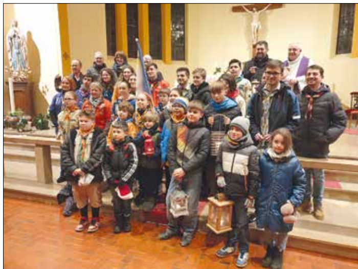
Übergabe des Friedenslichtes in Frauenkirchen (Frankreich) durch die französischen und deutschen Pfadfinder:innen.

„Es werden kommen von Osten und von Westen, von Norden und von Süden, die zu Tisch sitzen werden im Reich Gottes.“ (Lukas 13,29)