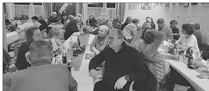
MGV Kulturgemeinde Sitterswald e.V.: Ein Verein mit Geschichte und Tradition

Bei der Jahresabschlussfeier des MGV Kulturgemeinde Sitterswald e.V., einem renommierten kulturellen Verein, wurde seine bedeutende Rolle innerhalb der Gemeinde erneut unterstrichen. Die Feier, die am 23. November 2024 im vereinseigenen idyllisch gelegenen Waldhaus in Sitterswald stattfand, diente dabei nicht nur der Unterhaltung, sondern war eine Hommage an die engagierte Vereinstätigkeit und gute Gemeinschaft.