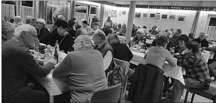
Jahresabschlussfeier 2024: Eine Feier der Gemeinschaft

tert. Der Verein ist dadurch um 60 Mitglieder gewachsen und zeigt sich so trotz seines Alters innovativ und anpassungsfähig.