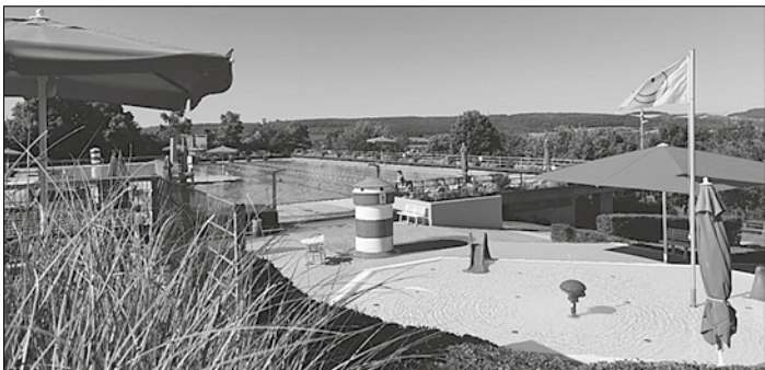
Die Freibadsaison geht in den Endspurt und mit dem Ende der Sommerferien wurden die Öffnungszeiten des Freibades weiter verkürzt. Bereits seit Anfang der Woche hat das Kleinblittersdorfer Freibad täglich nur noch von 13 bis 19 Uhr geöffnet (Kassenschluss ist um 18:15 Uhr).

Letzter Badetag ist am Sonntag, 10. September 2023 Bis Sonntag, 10. September 2023, haben Sie noch die Gelegenheit, das Kleinblittersdorfer Freibad zu besuchen. Auch am letzten Öffnungstag wird das Bad noch einmal von 13 bis 19 Uhr geöffnet haben (Kassenschluss ist um 18:15 Uhr).