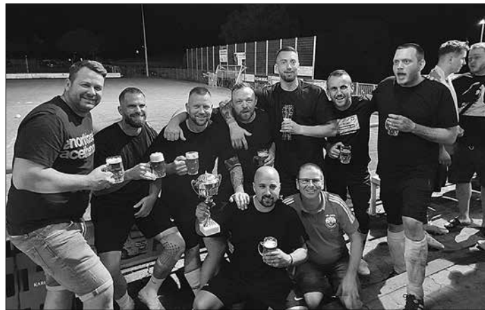
Sieger der 2. Copa de la Noche des SC Bliesransbach wurde die Mannschaft des FC 2,71 %o.

vom TuS Bliesransbach sowie Lokomotive Bliesgau für das Halbfinale. In Gruppe B waren dies der FC 2,71 %o sowie der fcf. Im ersten Halbfinale trafen dann TuS Bliesransbach und fcf aufeinander. Hier unterlagen die jungen TuS-Spieler knapp mit 5:6 den gestandenen fcf-Spielern. Das zweite Halbfinale entschied der FC 2,71 %o mit 2:8 gegen Lokomotive Bliesgau klar für sich. Im Spiel um den dritten Platz unterlag der TuS Bliesransbach schon wieder ganz knapp mit 2:3 – diesmal gegen die Lokomotive Bliesgau. Kurz vor Mitternacht stand dann nach einem spannenden 9-Meter-Krimi der Sieger der 2. Copa de la Noche statt – der FC 2,71 %o! In der regulären Spielzeit von 15 Minuten stand es zwischen dem fcf und FC 2,71 %o 5:5.