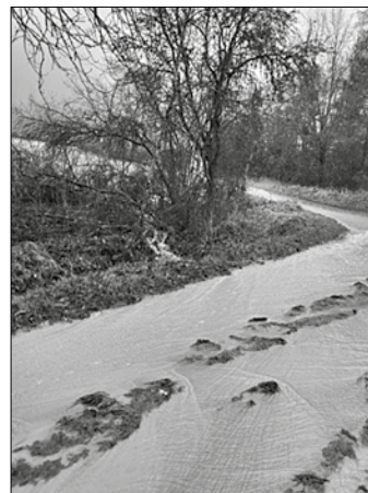
Das Niederschlagswasser findet nicht den gewollten Weg in den Bach

Die Ursachen für die Überflutung liegen einerseits an den Wassermengen aber auch hauptsächlich daran, dass das Wasser, so wie eigentlich vorgesehen, nicht in den Bühlbach geleitet wird. Wir haben uns Gedanken über eine bessere und dauerhaft wirksame Wasserableitung gemacht und kleine Maßnahmen umgesetzt, die auch schon beim letzten Regen ihre Wirksamkeit nachgewiesen haben. Das Kneipp-Anlagen-Team ist hierzu mit der Gemein-