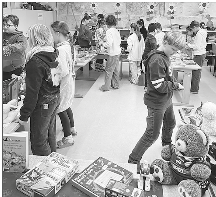
Hier suchen sich Kinder eines 4. Schuljahres ein neues Spielzeug aus.