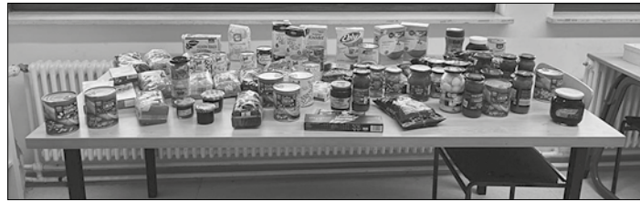
Sachspenden wie Nudeln, Reis und Konserven werden am 20.03.24 der Saarbrücker Tafel übergeben.