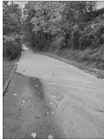
Überschwemmung des Weges in Richtung Dorf