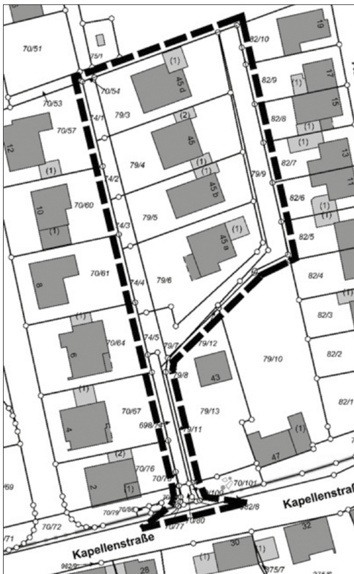
Abbildung: Geltungsbereich des Bebauungsplans „Nördlich der Kapellenstraße – 1. Änderung“, ohne Maßstab, genordet.

Weiterhin hat der Gemeinderat Kleinblittersdorf in seiner Sitzung am 19.12.2023 den Entwurf des Bebauungsplans „Nördlich der Kapellenstraße – 1. Änderung“ gebilligt und die öffentliche Auslegung gem. § 3 Abs. 2 BauGB beschlossen.