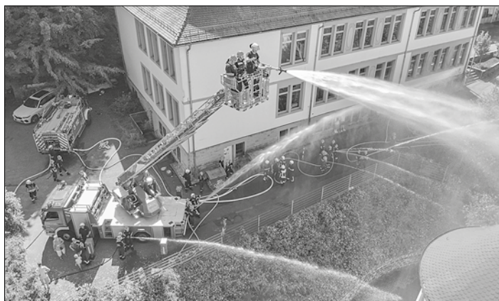
Die Jugendfeuerwehr übte die Brandbekämpfung der Kirche über mehrere Strahlrohre und die Drehleiter Die Kinder und Jugendlichen warfen gekonnt Schläuche aus, kuppelten mehrere Strahlrohre an, mit einem „Wasser marsch“ gaben die

Schallendes Martinshorn und eine Vielzahl an Feuerwehrfahrzeugen sorgten für einen unruhigen Samstagnachmittag in Oberwürzbach. Ursache des Großaufgebotes war die Jahresabschlussübung der Jugendfeuerwehr auf Stadtebene.