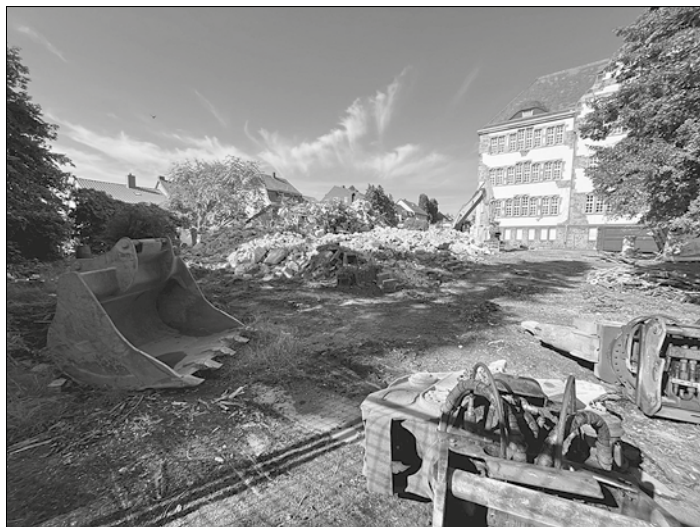
Die ehemalige Turnhalle weicht für den Bildungscampus Ludwigschule

Direkt nach dem Abriss wird die Sanierung des Altbaus beginnen und planmäßig im Sommer 2026 abgeschlossen werden. Der Neubau für das Erweiterungsgebäude soll im Herbst 2024 starten. Mit der Fertigstellung der gesamten Arbeiten wird im Frühjahr 2027 gerechnet. Dann werden etwa 250 Kinder wieder in der Ludwigschule lernen, lachen und spielen können.