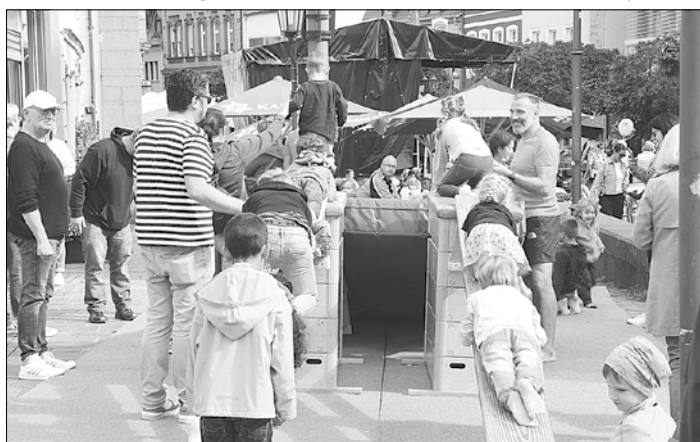
Viel Spaß hatten die Kinder auf dem Parcours des TV St. Ingbert

Neben den Ständen konnten sich die Kinder auch durch ein spannendes Bühnenprogramm unterhalten lassen. Nach dem Jugendorchester der Bergkapelle traten Kita-Kinder, die Bläserklasse der Albert-Weisgerber-Grundschule, die Tänzerinnen der Schermscha, die Tanzmäuse der DJK SG St. Ingbert, die Musikschule und die Gardetanzgruppe der KG „dann wolle ma emol“ Rohrbach auf. Zum Abschluss liefen beim Auftritt von zwei Clowns den Kindern, aber auch den Eltern und Großeltern die Lachtränen über die Backen. Bilder gibt es unter www.st-ingbert.de und Facebook: https://t1p.de/w9lj6