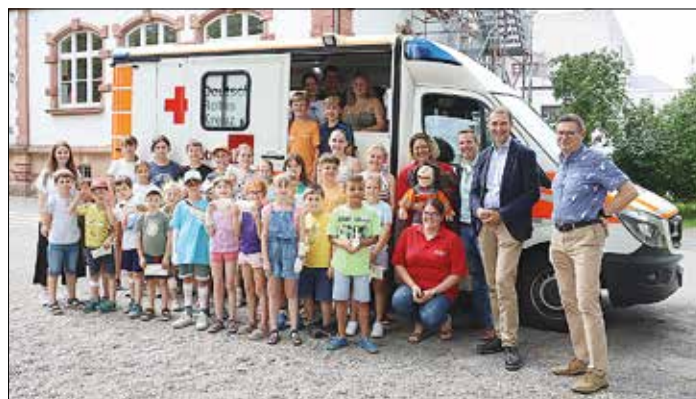
Paula besuchte die Fun Ferien Dengmert