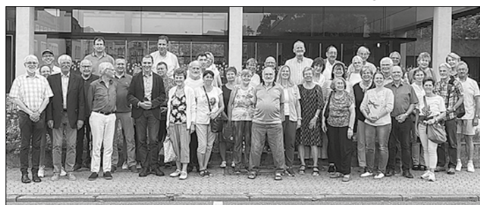
Die Besuchergruppe aus Radebeul vor dem St. Ingberter Rathaus