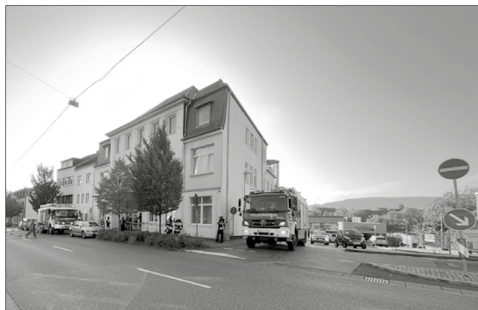
Die Feuerwehr rückte am Freitag zu einem Akkubrand in einer Wohnung in der Kohlenstraße aus.

Die Feuerwehr weist auf die Gefahr von E-Rollern bzw. die Gefahren eines Akkubrandes hin. Die Fahrzeuge sollten im Außenbereich sicher abgestellt werden und nicht in der Wohnung.