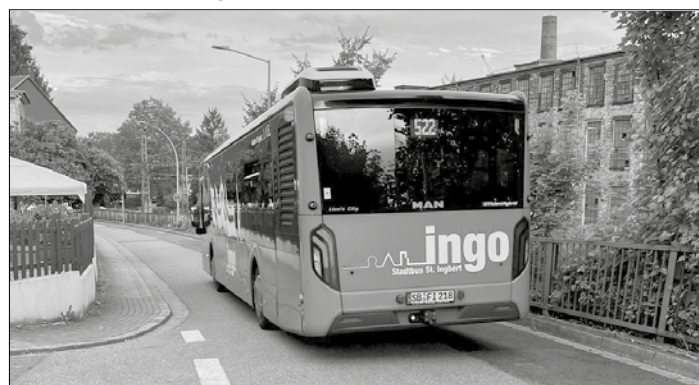
Freie Fahrt für den Verkehr in der Rentamtstraße

Die Rentamtstraße in St. Ingbert ist seit vergangen Freitag wieder befahrbar. Die Stadtwerke St. Ingbert investierte in die Infrastruktur. Neue Rohre für Gas und Wasser wurden verlegt. Die Baufirma erneuerte Hausanschlüsse bei den Anwohnern in der Straße. Die Verrohrungen waren mehr als 50 Jahre alt. Die komplette Asphaltierung und Fahrbahnerneuerung findet erst zu einem späteren Zeitpunkt statt.