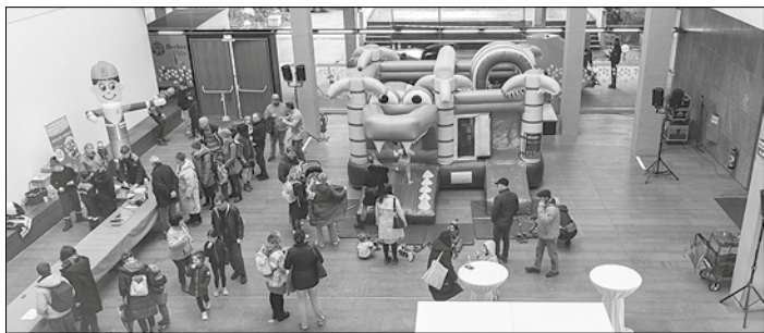
Für die Kleinsten gab es ein kunterbuntes Kinderprogramm