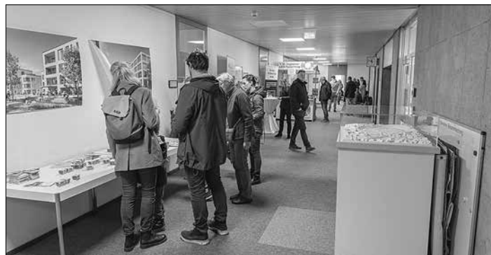
Die Verwaltung öffnete die Türen. Rund 2000 Besucher informierten sich im Rathaus

Im großen Sitzungssaal saßen an diesem Tag keine Ratsmitglieder, sondern Bürger, die unter anderem über das Projekt Baumwollspinnerei diskutierten und erfuhren, wie eine Ratssitzung abläuft. „Ich bin um 5.30 Uhr geboren“, freute sich eine Frau, die im Standesamt ihren Geburtszeitpunkt erfahren hatte, und ein Mann, der den Bogen einer theoretischen Fahrprüfung ausgefüllt hatte, jammerte lachend: „War das schon immer so schwer?“